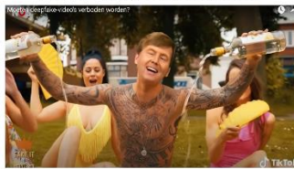
Klik op de afbeelding voor weergave video.